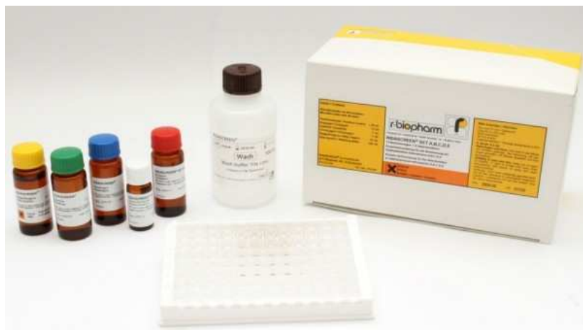
Рис. 1. Тест-система RIDASCREEN® SET Total